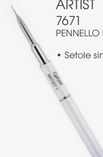
ARTIST 1 7671 PENNELLO DI PRECISIONE