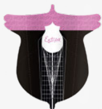
NAIL FORMS STYLE 7519 CARTINE A FARFALLA