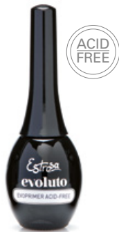
EVOPRIMER ACID-FREE 8347 PRIMER NON ACIDO