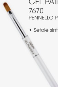
GEL PAINTER 6 7670 PENNELLO PIATTO OVALE